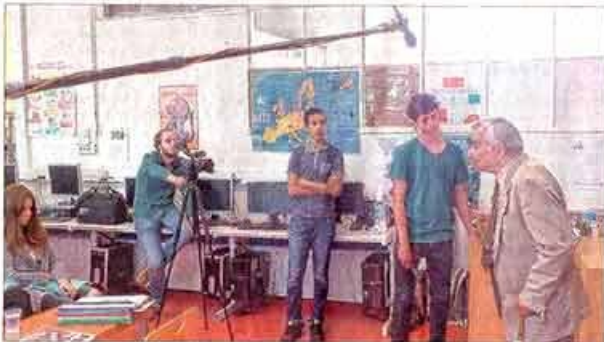
Arsène Tchakarian est le dernier survivant du groupe Manouchian.